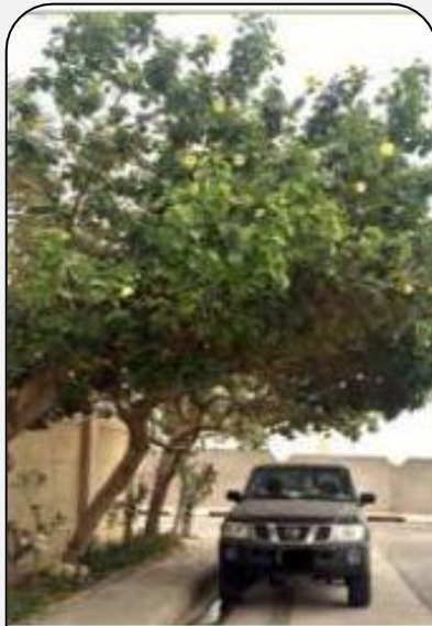
شجر الخبيز الساحلي