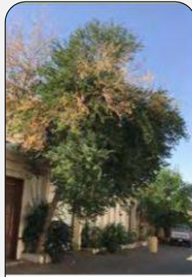
شجر اللوز الهندي